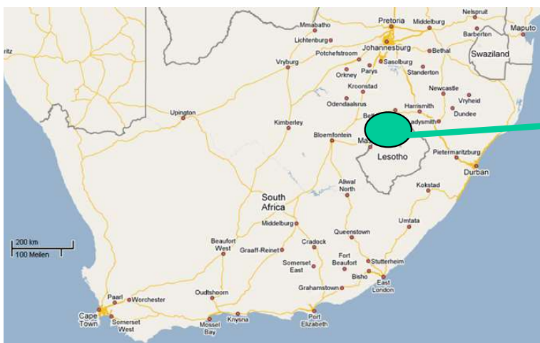
Golden Gate National Park