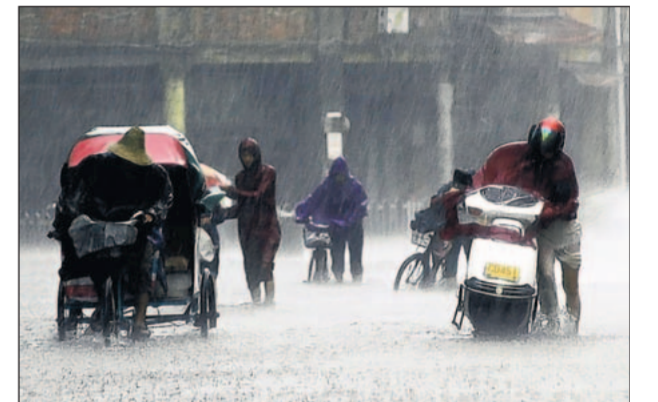
Mühsam kämpfen sich diese flüchtenden Chinesen mit ihrem Hab und Gut durch überflutete Straßen.

Die Sache flog auf, weil eine heimlich angebrachte Überwachungskamera in der Wohnung alles aufgezeichnet hatte. Der Pfleger wurde zu vier Jahren Haft verurteilt. Seinen Beruf darf er nie mehr ausüben.